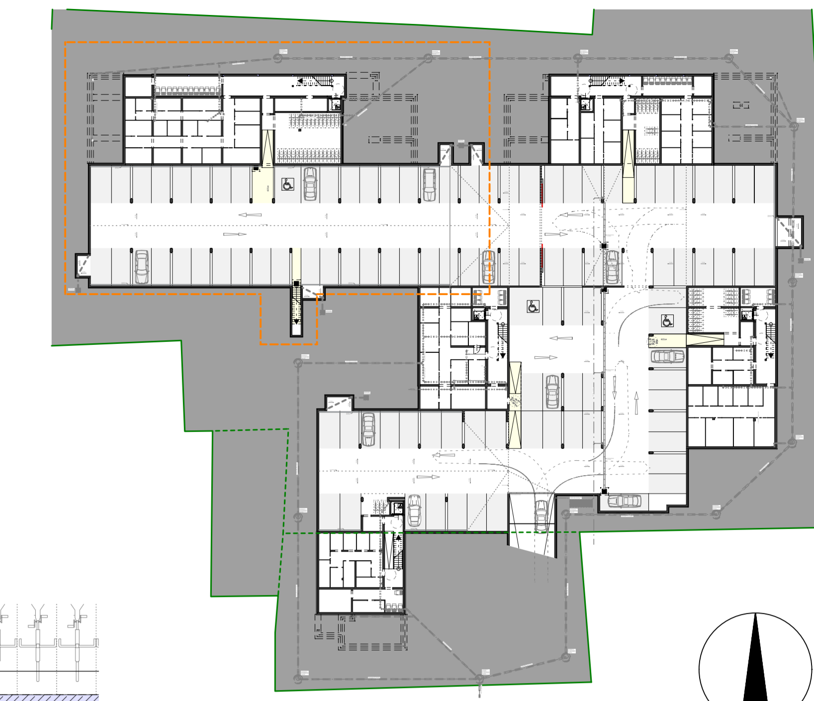
UNTERGESCHOSS M 1:500