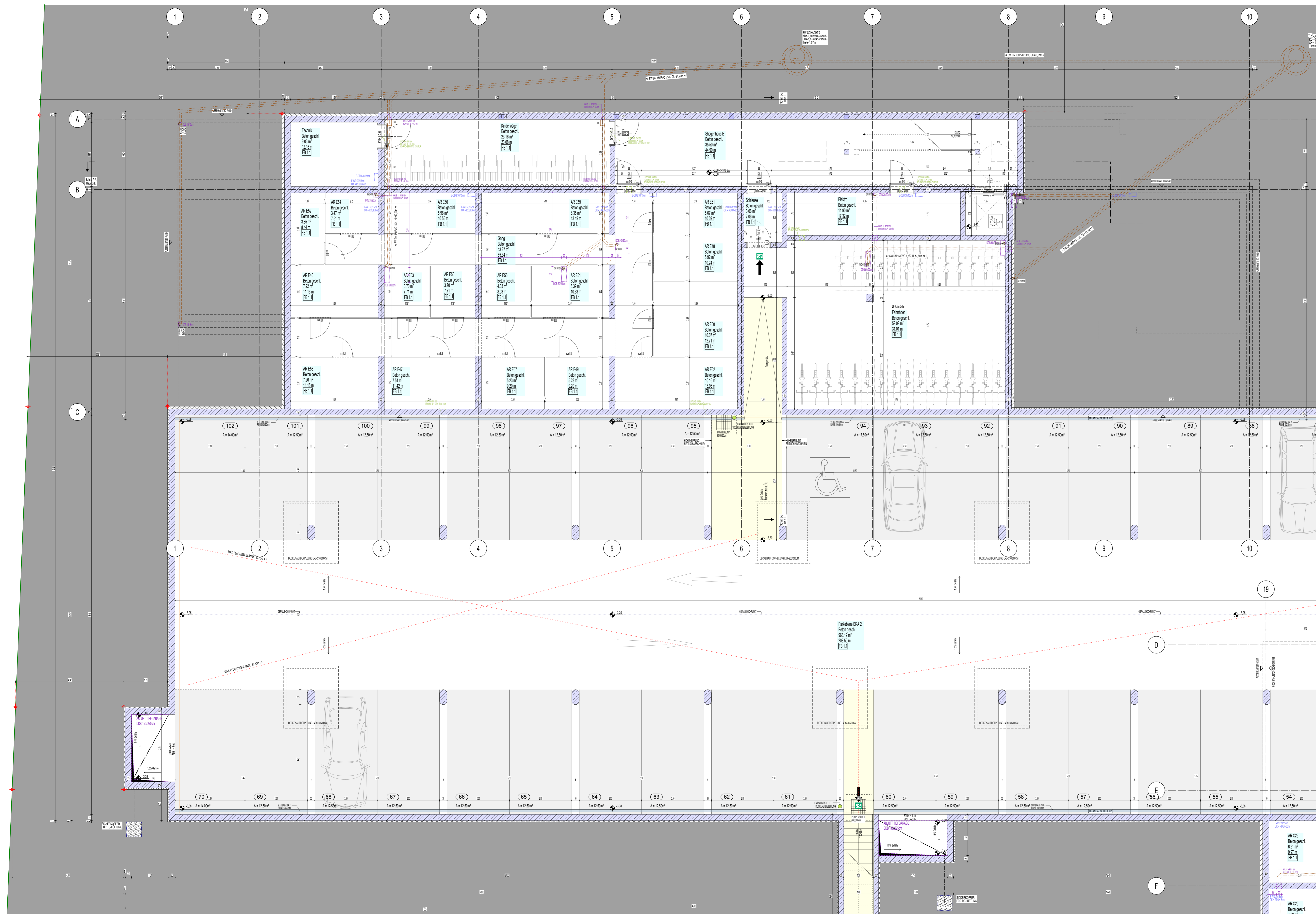
GRUNDRISS UNTERGESCHOSS M 1:50_ TEIL 04